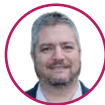
GONZALO CHACON 55 ANS INSPECTEUR DE L'ÉDUCATION NATIONALE